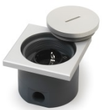
7601 instortvloer- doos voor buiten