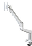
TFT arm Stockholm